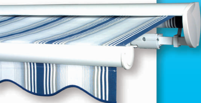
G150 Ausführung mit Schutzdach