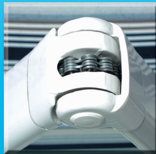
Gelenk mit extra starker Flyer-Kette